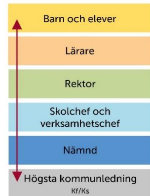
Figur 1 Bild av styrning och ledning

En central del i hur huvudmannanivån styr handlar om att utifrån analys verka för likvärdighet och säkra undervisningens kvalitet. Detta blir synligt i prioriteringar, planering och genomförande av insatser.